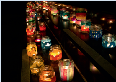
Wereldlichtjesdag Nijmegen

Er zijn geen woorden die verzachten. Er is niets vrooms om de wonden te zalven. Er is nu duisternis. Marinus van den Berg