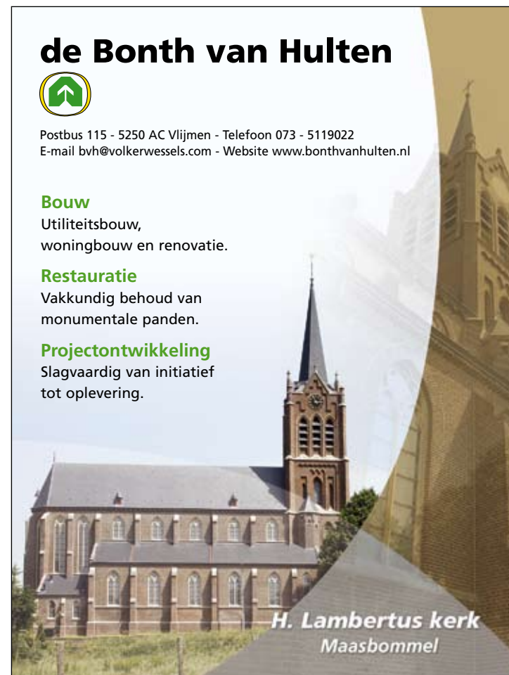
H. Lambertus kerk Maasbommel

Slagvaardig van initiatief tot oplevering.